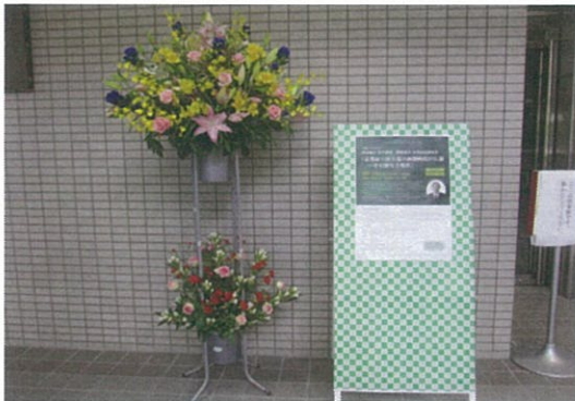
「講師から自己紹介」